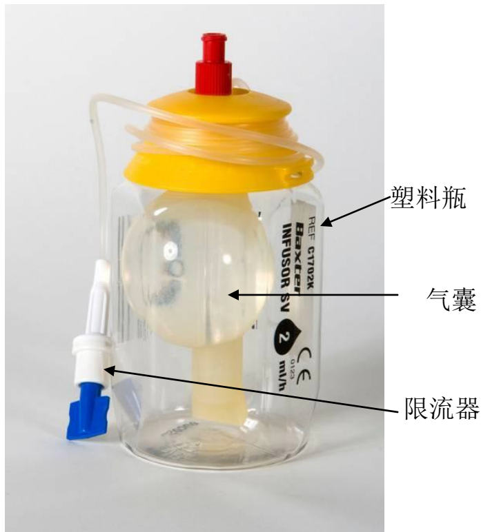
连接后气囊的样子