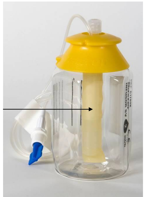
清空后气囊的样子